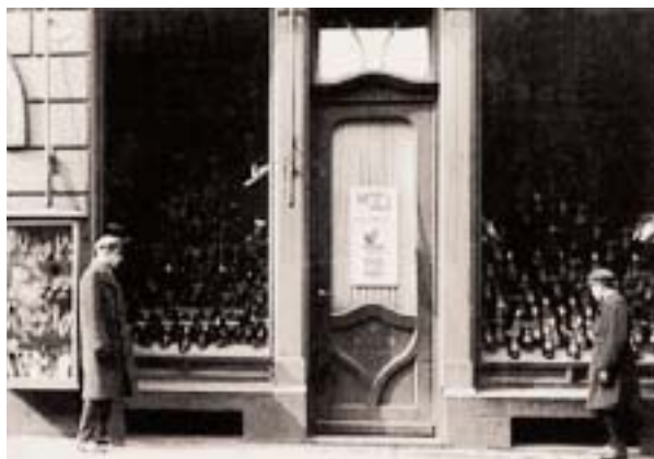
Schuhhaus Balkind, eine von fünf Filialen in der Stadt