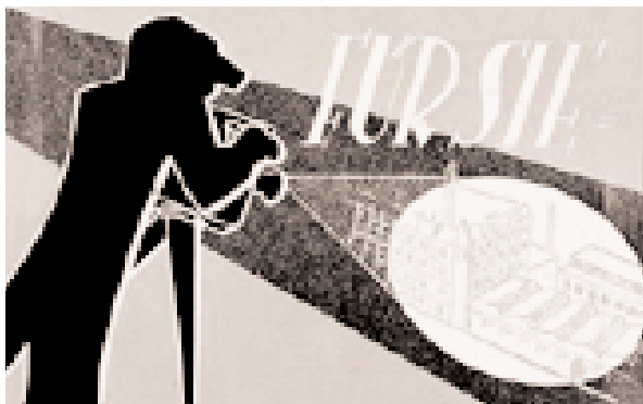
Gebrüder Goeritz AG Titelblatt einer Werbebroschüre aus den 1930er Jahren