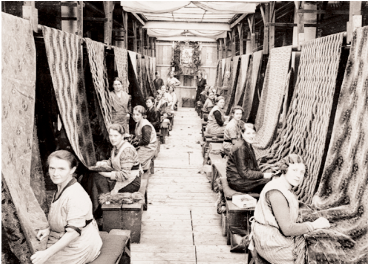
Gebrüder Goeritz AG, Möbelstoffweberei Beckerstraße 11–13, um 1930

insbesondere aus den USA und aus England, aber auch aus Holland, Belgien und aus der Türkei, wuchs in den folgenden Jahrzehnten sprunghaft an.