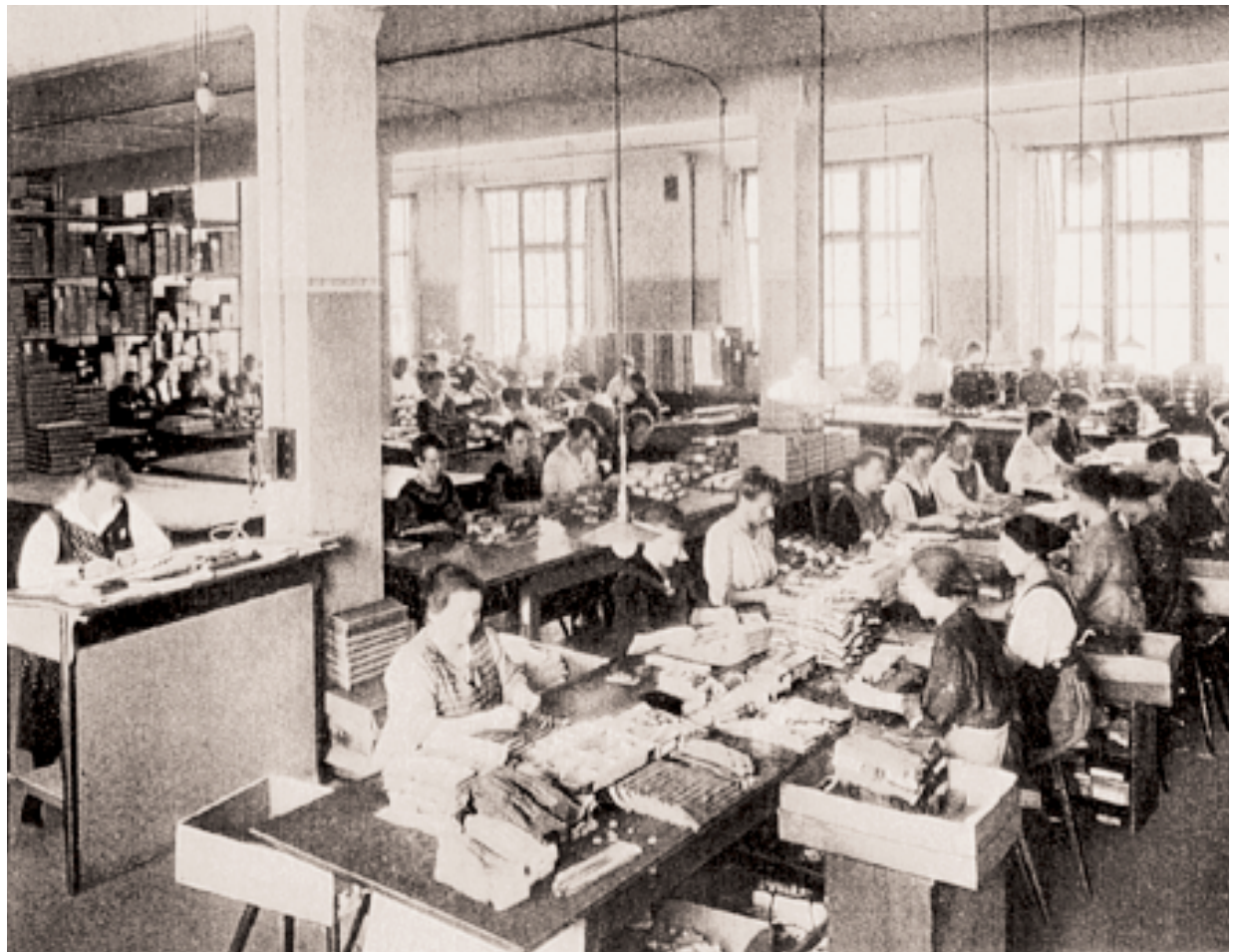
Gebr. Becker Handschuhlegerei