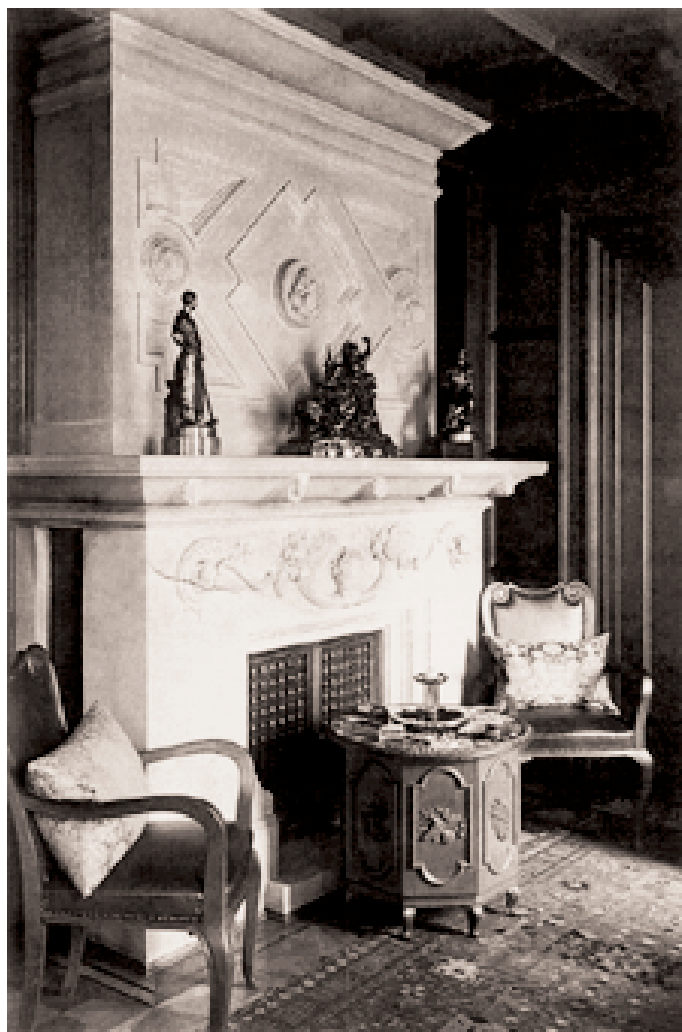
Villa Karl Becker in der Parkstraße 22, Interieur gestaltet vom Architekten Basarke