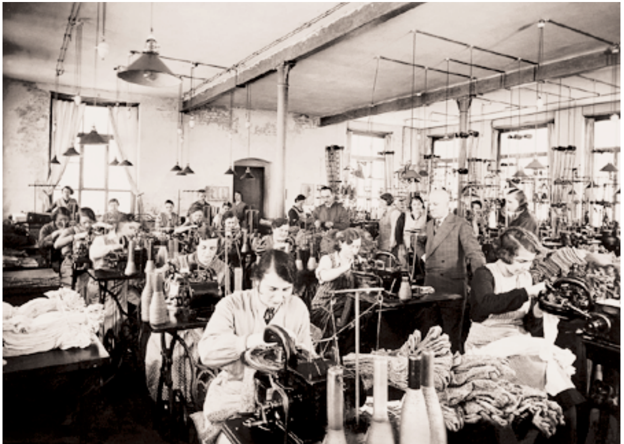
Louis Lewy & Co. Teilansicht der Dampf-Formerei

Insgesamt läßt sich folgendes Resümee ziehen: »Anpassungsfähigkeit, Innovationsfähigkeit, Rastlosigkeit, [...] Mobilität, Zielstrebigkeit, Arbeitsethos, Verhandlungsgeschick, Herstellen von Allianzen [...], Streben nach hohen Gewinnen [...], rückhaltloser Fortschrittsgeist, weil nicht traditionsgebunden und bodenständig, Selbständigkeit (Individualität) und Liberalität« 79 waren ohne Zweifel auch die Charakteristika, die für die jüdischen Unternehmerfamilien in Chemnitz zutrafen. Sie bildeten die Grundlage für den Erfolg im regionalen, nationalen und internationalen Maßstab bis 1933 und zum Teil auch darüber hinaus.