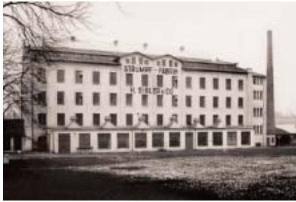
H. Sigler & Co. Strumpffabrik in Chemnitz um 1930

sie ausschließlich in Sachsen tätig, so daß sie in der Fachwelt als »Dependance der Gebr. Arnhold« wahrgenommen wurde. 64 Besondere Verdienste erlangte das Bankhaus im sächsischen Effektenhandel. 65